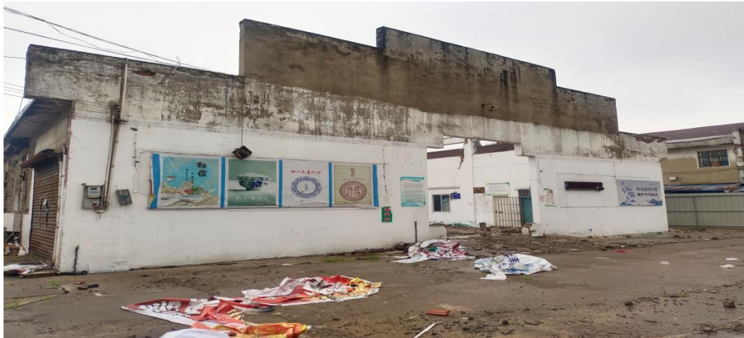
水东农贸市场改造前