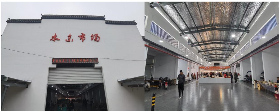
水东农贸市场改造后正门 水东农贸市场改造后内部